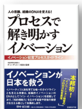
特定非営利活動法人 ITコーディネータ協会監修 (日経BP社刊)