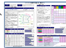
イノベティブ人財診断™[個人編][SX] 分析画面