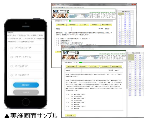
▲実施画面サンプル