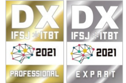
▼認定ステッカーサンプル