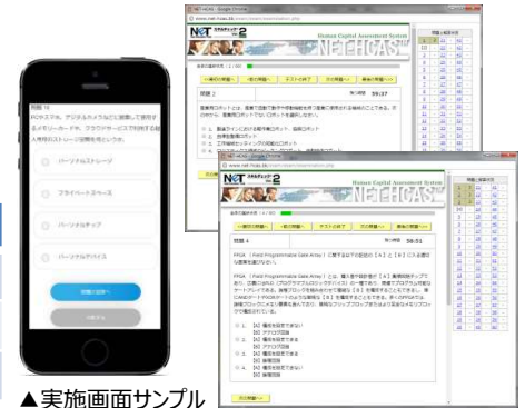
▲実施画面サンプル