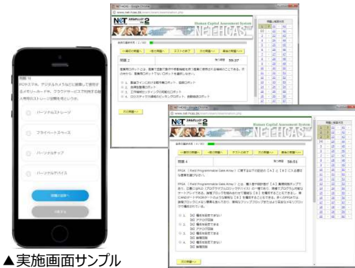
▲実施画面サンプル