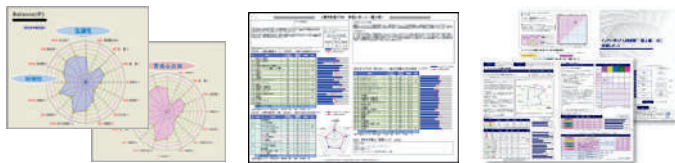
▲診断結果のイメージ(一部)

[生成AIを使いこなして事業・サービスに活用できる社内人財発掘のためのNETアセスメント・分析パッケージ] (企業向け製品版 合計お1人当たり標準価格3万円相当以上) ・適性・資質診断「NET*ASK™」 ・総合コンピテンシー診断「人間力診断™」 ・「イノベティブ人材診断™[改訂新版]」 ・診断後「分析結果報告資料」を企業様向けにご提供